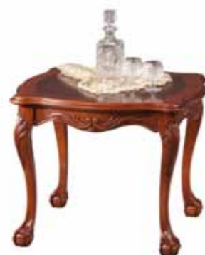
TI 1053 Ława mała Small Coffee Table Малая скамейка