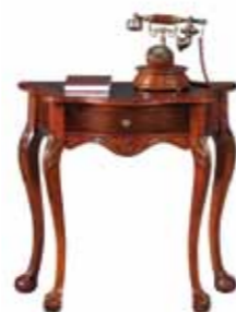
Ti 1058 Konsola mała Small Console Table Малый туалетный столик