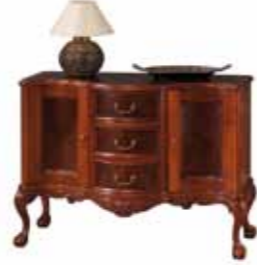
KAS 1004 Komoda 2 drzwiowa mała Small 2-Door Chest of Drawers Малый двустворчатый комод