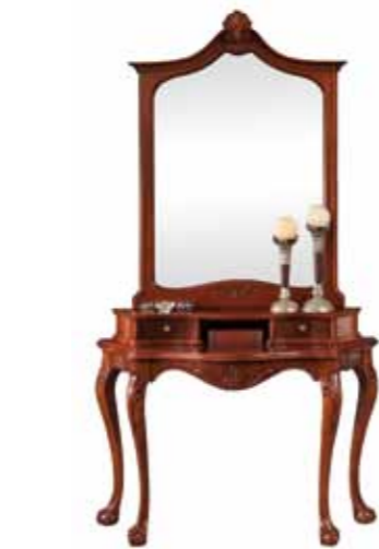
Ti 1055 + Ti 1057 Konsola duża z nadstawką+lustro Large Console Table with Upper Section+mirror Туалетный столик с надставкой+Зеркало