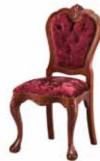
ST 1070 Krzesło OT Upholstered-Back Chair Стул, спинка обита