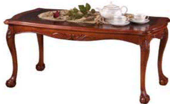
TI 1052 Ława duża Large Coffee Table Большая скамейка