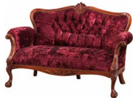
WY 1091 Kanapa wypoczynkowa 2-osobowa 2-Seat Couch Двухспальный диван 96,5 / 148 / 80