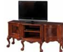
KAS 1010 RTV TV Stand Столик под телевизор