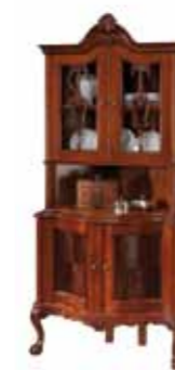
KAS 1008 Witryna narożna Corner Display Cabinet Угловая витрина