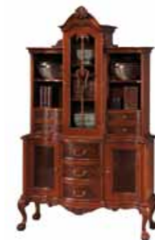
KAS 1003 Kredens mały Small Kitchen Dresser Малый буфет