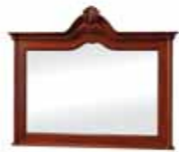
KAS 1005 Lustro małe Small Mirror Малое зеркало