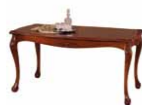
Ti 1051 Stół mały Small Table Малый стол