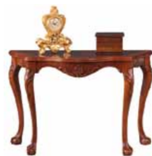
Ti 1056 Konsola duża Large Console Table Большой туалетный столик