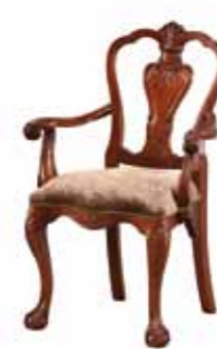
ST 1073 Fotel OD Wooden-Back Armchair Кресло с деревянной спинкой