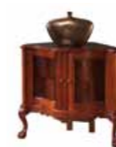
KAS 1009 Komoda narożna Corner Chest of Drawers Угловой комод