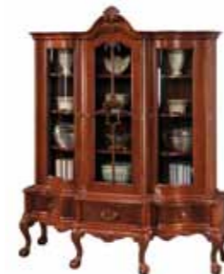
KAS 1006 Witryna Display Cabinet Витрина