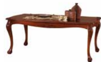
Ti 1050 Stół duży Large Table Большой стол