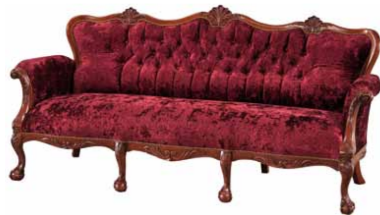
WY 1092 Kanapa wypoczynkowa 3-osobowa 3-Seat Couch Диван трехместный 96,5 / 207 / 80