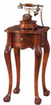
TI 1054 Stolik Table Столик