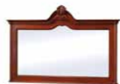
KAS 1002 Lustro duże Large Mirror Большое зеркало