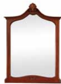
Ti 1057 Lustro do konsoli Console Table Mirror Зеркало для туалетного столика