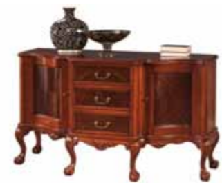
KAS 1001 Komoda 2 drzwiowa duża Large 2-Door Chest of Drawers Большой двустворчатый комод