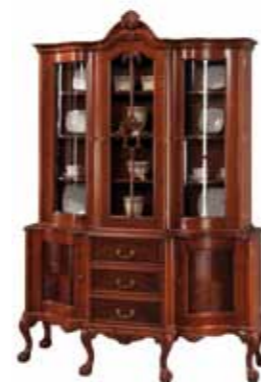
KAS 1000 Kredens duży Large Kitchen Dresser Большой буфет