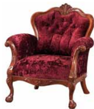
WY 1090 Fotel wypoczynkowy Armchair Кресло 96,5 / 89 / 80