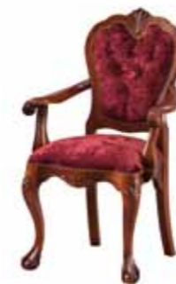
ST 1071 Fotel OT Upholstered-Back Armchair Кресло, спинка обита