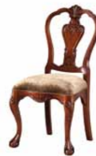
ST 1072 Krzesło OD Wooden-Back Chair Стул с деревянной спинкой