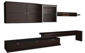
Вариант 730 состоит из: ТИП 339, 341, 373, 441, 552, 530 дополнительно подсветка 02.702.ZB, 3x02.735.ZB, 02.799.ZB