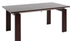
S9402 (Y1) Стол