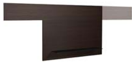
ТИП 565 Навесная панель левая/правая дополнительно подсветка 02.703.ZB