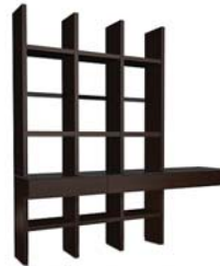
ТИП 430 Стеллаж левый/правый дополнительно подсветка 02.703.ZB