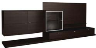
Вариант 921 состоит из: ТИП 338, 339, 565, 552, 373, 530 дополнительно подсветка 02.702.ZB, 02.703.ZB, 02.799.ZB