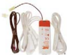
Подсветка ТИП 02.799.ZB сенсор TipTronic KOCH - 1 шт. к типам: 551, 552