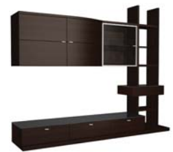
Вариант 993 состоит из: ТИП 339, 373, 431, 552, 530 дополнительно подсветка 02.702.ZB, 02.799.ZB