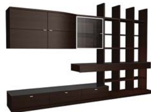
Вариант 991 состоит из: ТИП 338, 339, 430, 552, 373, 530 дополнительно подсветка 02.702.ZB, 02.703.ZB, 02.799.ZB