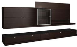
Вариант 941 состоит из: ТИП 338, 339, 601, 602, 552, 372, 373, 530, 565, 850 дополнительно подсветка 02.702.ZB, 02.703.ZB, 5x02.735.ZB, 02.799.ZB