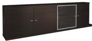
Комод 4D состоит из: ТИП 2x601, 551, 552, 701